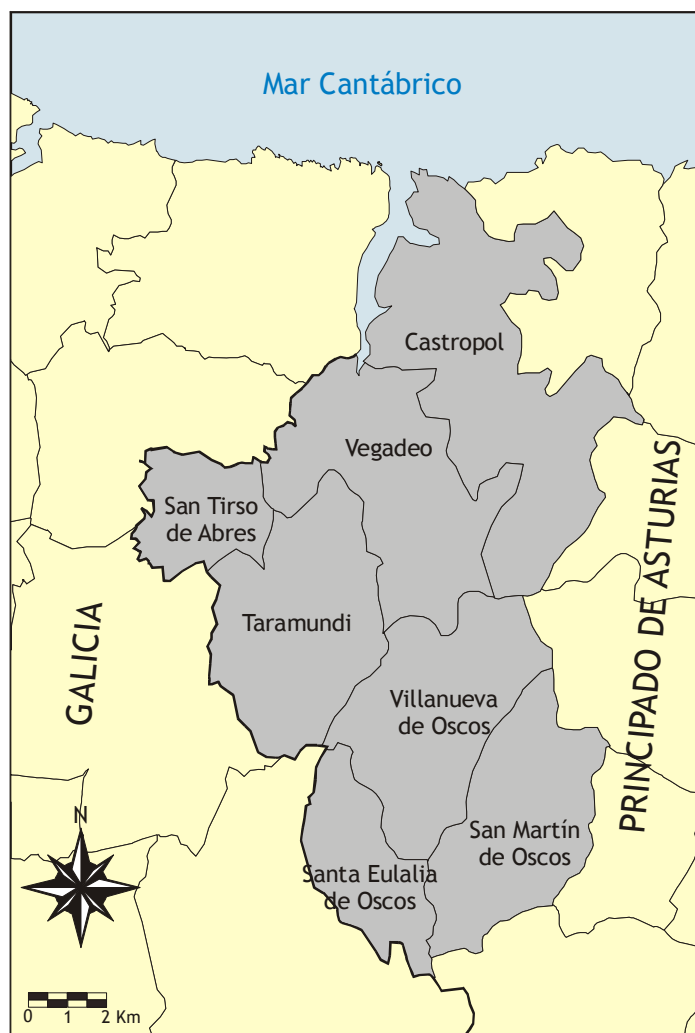
FIG. 1. LOCALIZACIÓN DE LOS MUNICIPIOS DE LA COMARCA “OSCOS-EO”

Desde mediados de los años 1990 Asturias ha ido de forma individual y sin contar con apenas colaboración por parte de la vecina Galicia, declarando una serie de parques naturales y espacios protegidos. La Ría del Eo es uno de los más emblemáticos, ya que, aparte de ser compartida por ambas, posee un sistema intermareal peculiar, habitado por numerosas especies de aves. Esta inclusión de las marismas de la Ría del Eo en la red de espacios protegidos de Asturias se vio contestado, por su parte, por la Xunta de Galicia, que creó, poco después, un órgano muy similar. Por tanto, la protección de la Ría del Eo quedaba dividida entre dos administraciones.